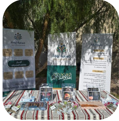
مستشفى إرادة والصحة النفسية بالقرريات.