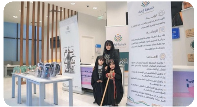
مركز المرأة والطفل .

• شاركت الجمعية في فعاليات يوم التأسيس في مستشفى إرادة والصحة النفسية بالقرريات وأيضاً في مركز الإصلاح والتأهيل بسجن القرريات. وتأتي هذه المشاركة ضمن جهود الجمعية في تعزيز الشراكة المجتمعية وترسيخ دورها.